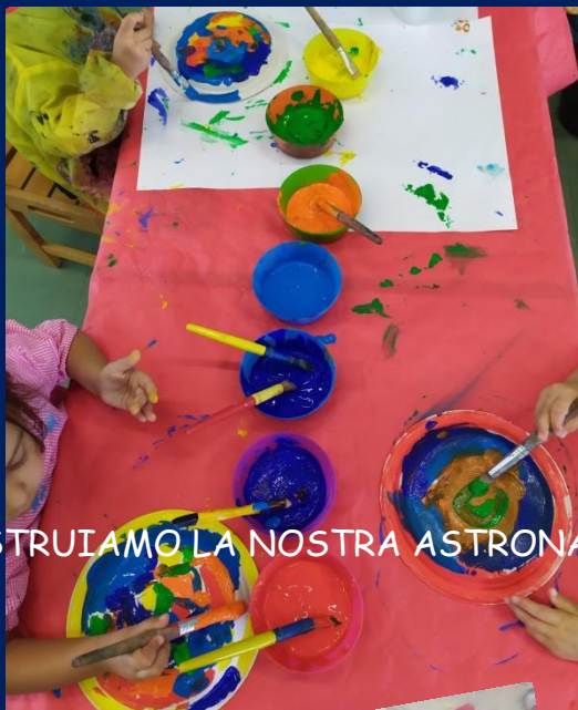
COSTRUIAMO LA NOSTRA ASTRONAVE E SEGUIAMO IL PERCORSO STELLARE