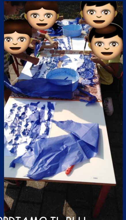
SCOPRIAMO IL BLU