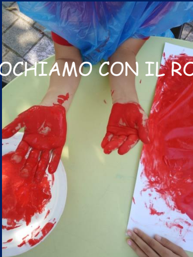
GIOCHIAMO CON IL ROSSO